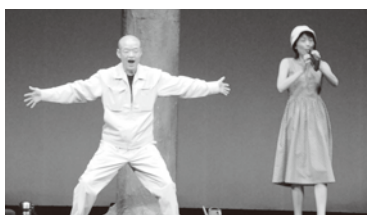
アクテノン シニア演劇部発表会 「いっぽんのキ」 '09年12月11日・12日 中村文化小劇場にて