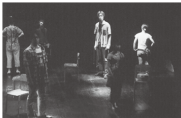
劇団翔航群 第30回公演 「やっちゃった」 '09年8月1日・2日 愛知県芸文小ホールにて

今回が、今回がと思いながらも、まだまだ“終わる”訳にはいかない。時に走り時に歩み、この先も継続していくのであろうな、と期待半分、不安半分で、今日も翔航群は、継続中。